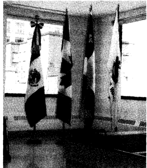
Interior de la galería de arte de la ESECA

Un elemento muy importante para tomar la decisión fue la situación histórico-política de Canadá, país multicultural, con profundas raíces tanto francesas como inglesas. Canadá es sobre todo, el resultado del desarrollo de estas dos culturas en América. Con esto en mente, se pensó que la capital, situada en la frontera entre el Canadá inglés y el Canadá francés, podría ser el lugar adecuado. Establecer la escuela en la ciudad de Ottawa ofrecía ventajas adicionales, como la cercanía con la Embajada de México.