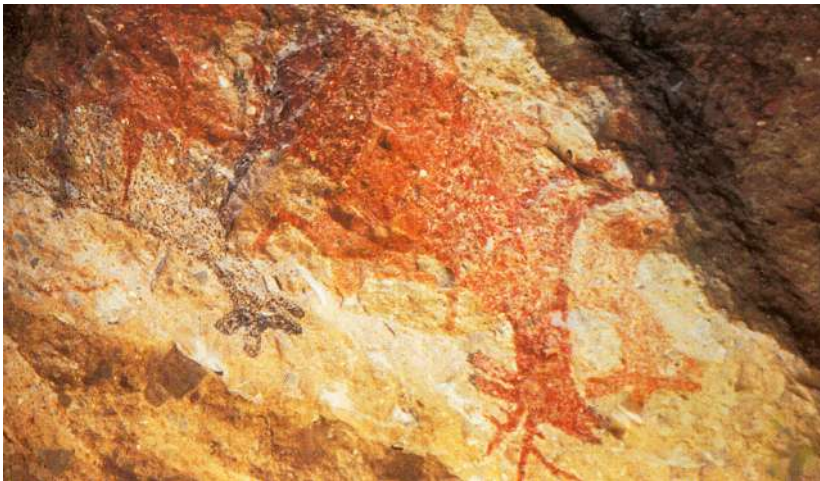
Pinturas rupestres. Baja California.

Buscaron mejores lugares para vivir, algunos se quedaron en regiones conocidas y otros buscaron nuevos horizontes. Vivieron temporalmente de acuerdo a la existencia de agua y caza, y habitaron en cuevas en las que dejaron algunas pinturas rupestres.